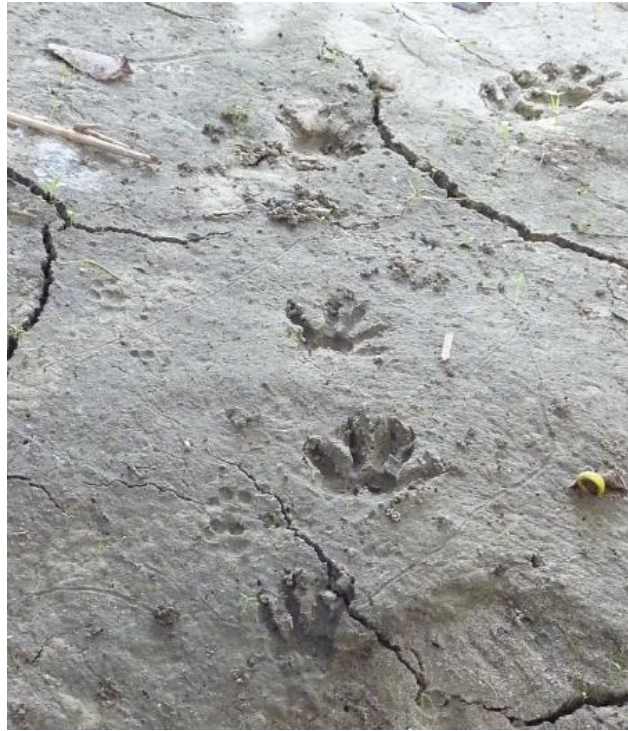
Imagen X. Rastro de Mapache sobre sustrato arcilloso